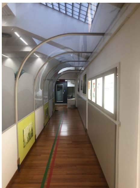
Tunnel di collegamento e sala riabilitazione