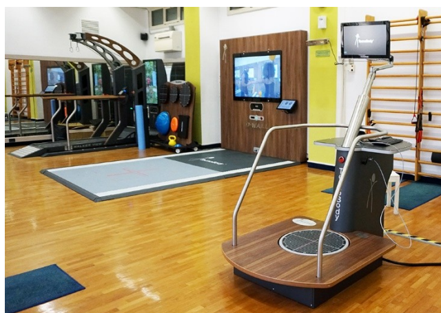
Sala di riabilitazione

Offriamo inoltre la possibilità di effettuare direttamente presso il nostro centro visite specialistiche private nei seguenti campi: