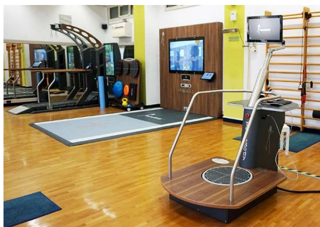
Sala di riabilitazione

Offriamo inoltre la possibilità di effettuare direttamente presso il nostro centro visite specialistiche private nei seguenti campi: