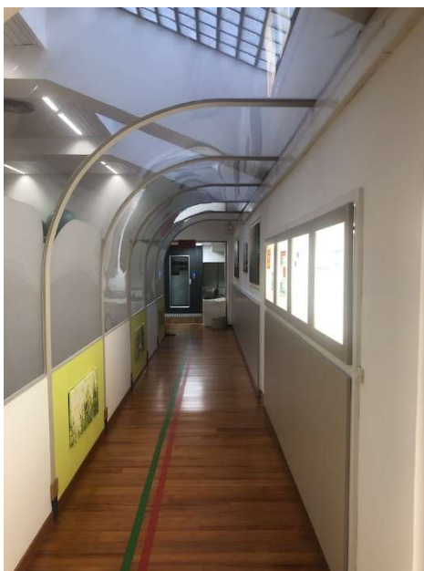
Tunnel di collegamento e sala riabilitazione