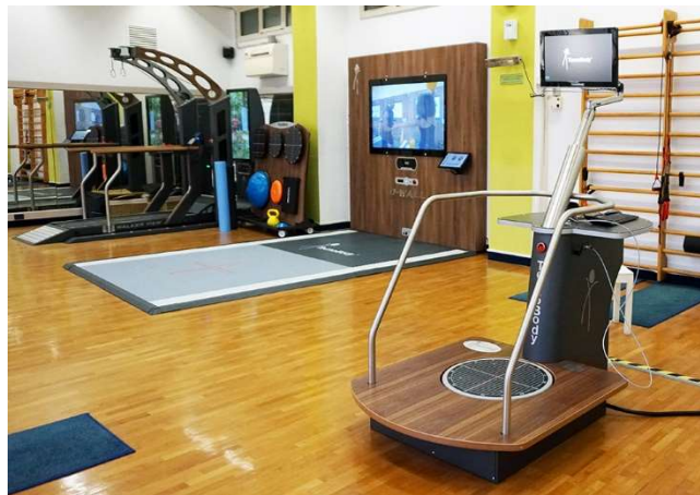
Sala di riabilitazione

Offriamo inoltre la possibilità di effettuare direttamente presso il nostro centro visite specialistiche private nei seguenti campi: