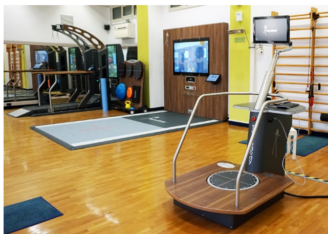
Sala di riabilitazione

Offriamo inoltre la possibilità di effettuare direttamente presso il nostro centro visite specialistiche private nei seguenti campi: